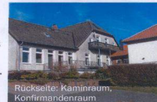
Rückseite: Kaminraum, Konfirmandenraum

Es gibt eine Tischtennisplatte und Tischfußball. Tafeln, Dia-Videogeräte und Musikanlage sind vorhanden und dazu ein Klavier. Für gottesdienstliche und musikalische Veranstaltungen kann nach Absprache die nahe Dorfkirche genutzt werden.