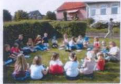
Garten auf der Hausrückseite