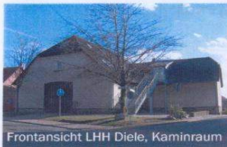
Frontansicht LHH Diele, Kaminraum

Am Ende der Märkischen Straße, an der unser Freizeitheim liegt, sind Rasenflächen mit Spielplatz und Fußball-